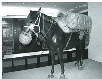
新博物館第2展示室