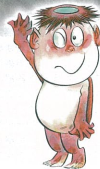
『遠野物語』100周年キャラクター 「かたるくん」

The 100th Anniversary of The Legends of Tono 2010